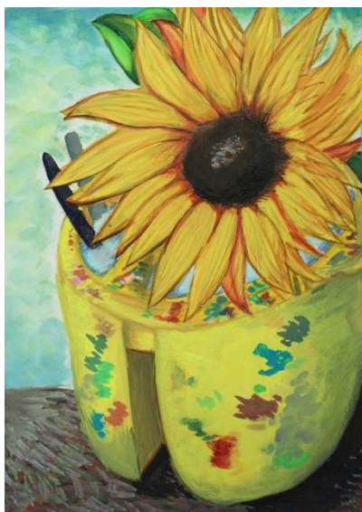
▲『ひまわりのある風景』(1年)